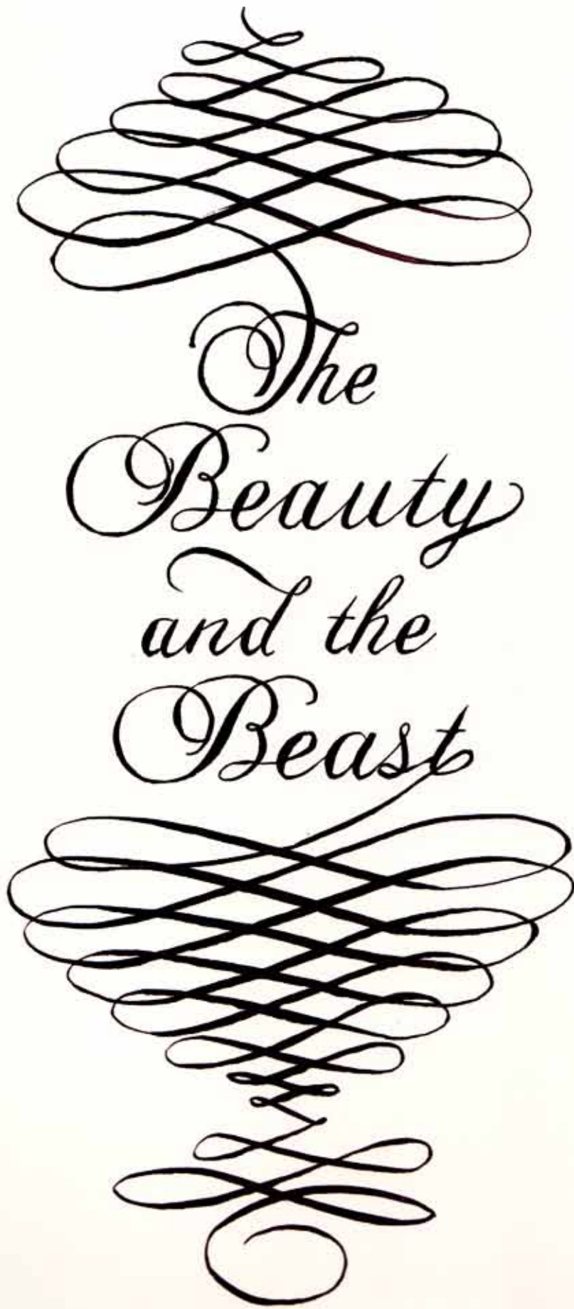
titel "The Beauty and the Beast" job Titel Illustration description pen and ink drawing on paper, 16th century