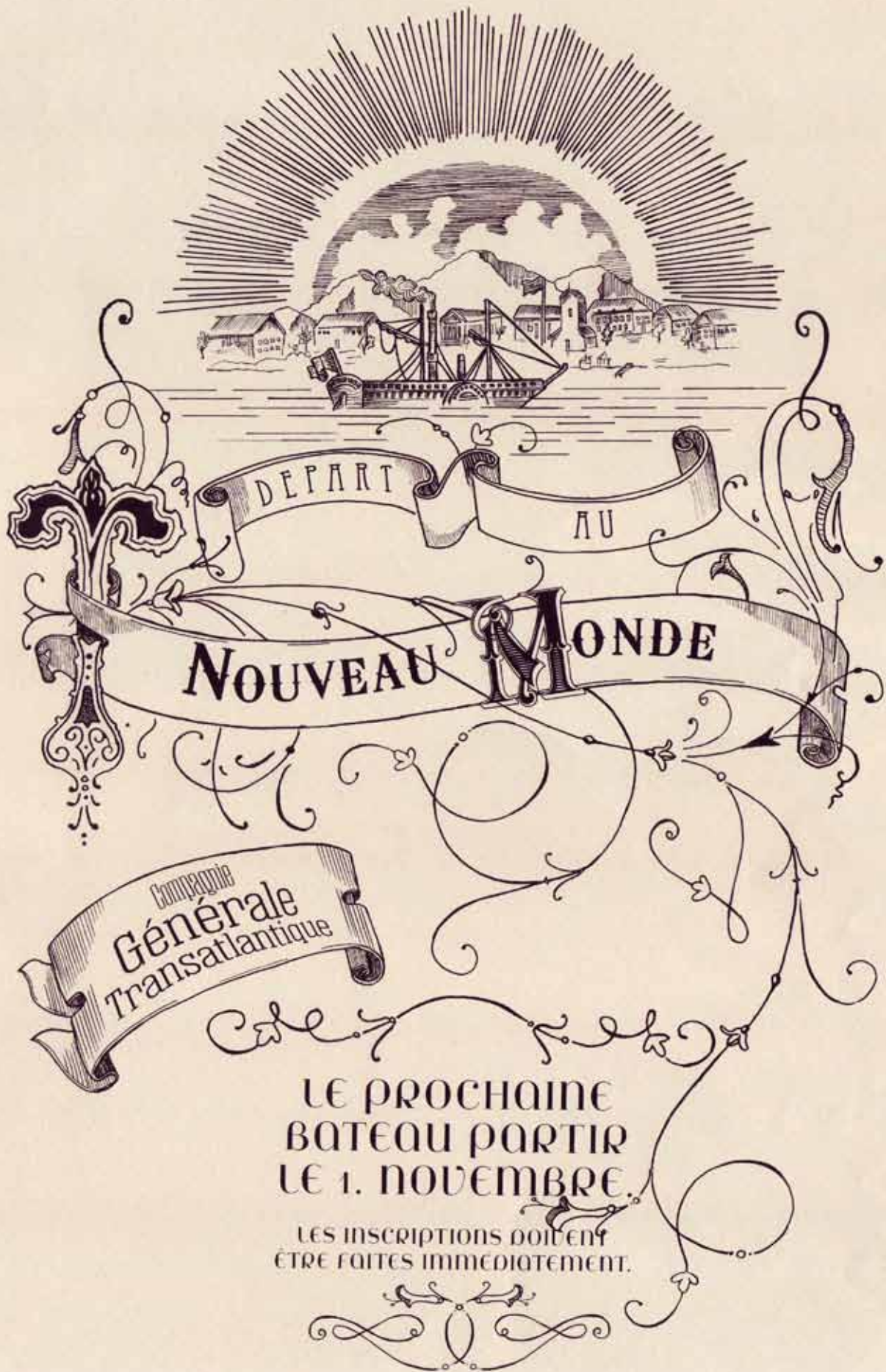
titel "Depart Au Noveau Monde" job Poster original size 420 x 297 mm description pen and ink drawing on paper combined with printed text, 19th century